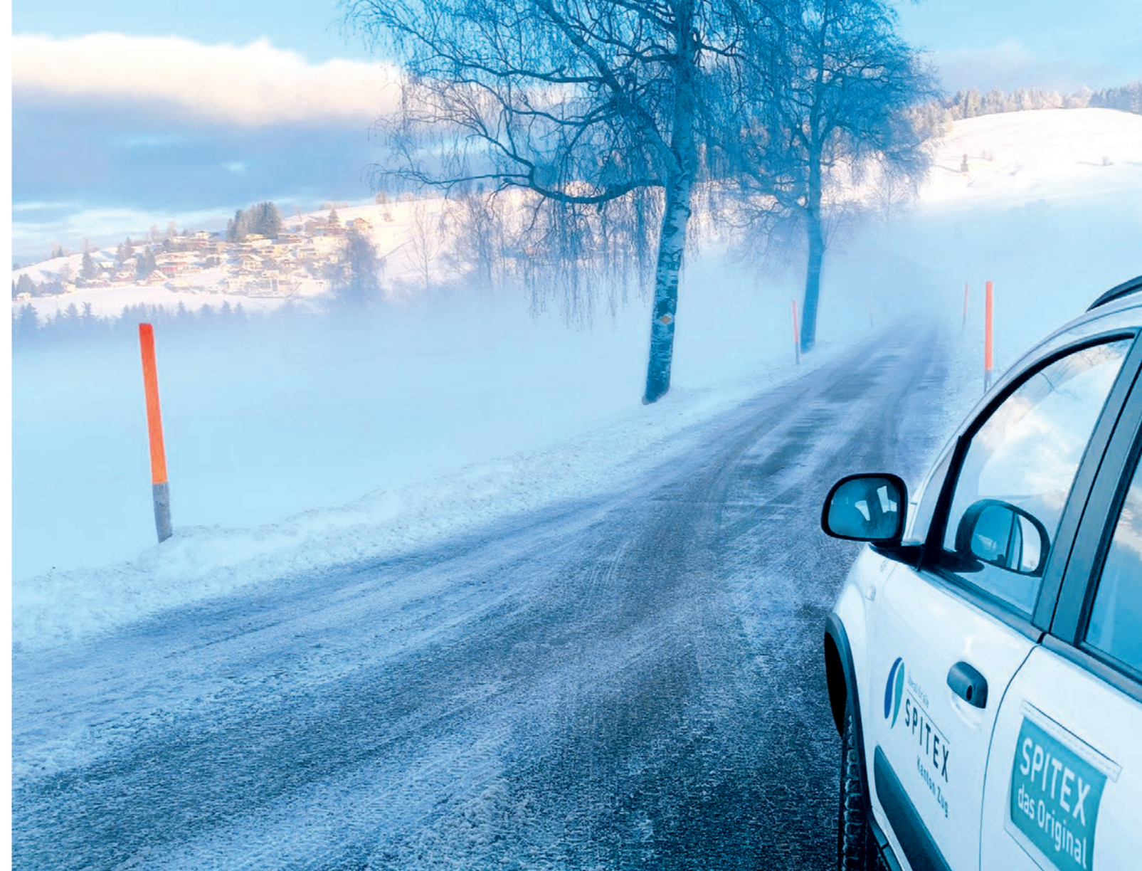
Wo Bedarf ist, sind wir für alle Einwohnerinnen und Einwohner des Kantons Zug im Einsatz – auch bei winterlichen Strassenverhältnissen.

Unseren zahlreichen ZUWEISENDEN, PARTNERINNEN und PARTNERN für die gute Zusammenarbeit.